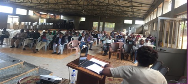
ባኮ ሙ.ወ. #1 ወላጆች በሥልጠና ላይ