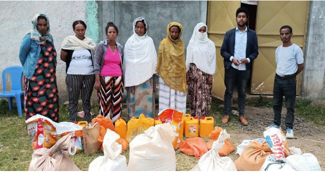
በወልዲያ የእውነተኛ አምልኮ እንቅስቃሴ ጅምር

ክፍል ሁለት፣ 'የእውነተኛ አምልኮ እንቅስቃሴ' ተግባራዊነት ጅምር ወልዲያ ሙሉ ወንጌል እክል 2021 ሙሉ ፓኬጅ ሥልጠና ተሠርቶበት የነበረ ሲሆን በኋላ በሰሜኑ ክፍል በነበረው ጦርነት ክልል ውስጥ የነበረች ከተማ ናት፤ 'Genuine Worship Initiative' ቀደም ብሎ በተቀመጠው ስትራቴጂ (20:80) ከድህነት የተነሳ ማከናወን ባይቻልም ጥቂት ባብዛኛው የሌጋሲ አባላትና ደጋፊ ባዎች (9500) እና ከሌጋሲ መጠባባቂያ ፋንድ (30500 ሺህ) በድምሩ 40 ሺህ ብር ወጪ ተደርጎ በወልዲያ ሙሉ ወንጌል አማካይነት ለ10 ተጠቃሚዎች (ተፈናቃዮችና ምስኪኖችን ጨምሮ) ሶስት ዓይነት ምግቦች (ዘይት፣ ምስር ጤፍ) ገዝቶ ማከፋፈል ተችሏል። አሰሩን ግለሰቦች ጨምሮ ከነቤተሰባቸው የተጠቃሚዎች ቁጥር ወደ 30 ናቸው።