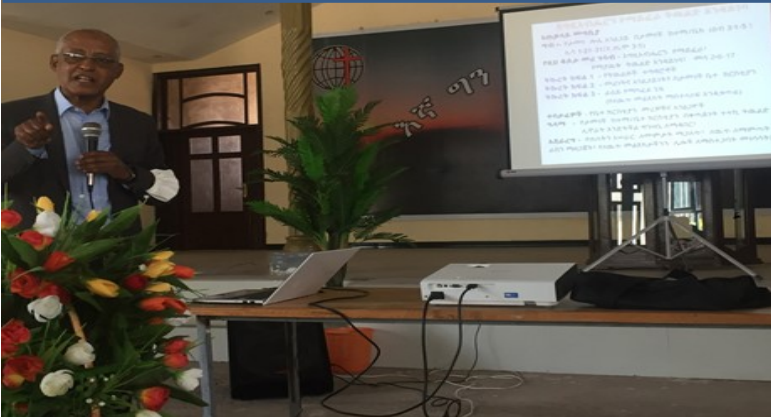
ስምጥ ሸለቆ መሠረተ ክርስቶስ አገልጋዮችን በማሠልጠን ላይ

ሀ. ከጎተራ ሙሉ ወንጌል በአንድ ቀን ውሎ የተካፈሉት ወላጆች ቁጥር 87 ናቸው፤ ወላጆቹ እስከ 12 ዓመት ዕድሜ ልጆች ያላቸው ናቸው፤