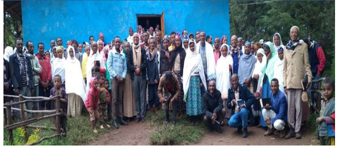
አምቦ ሙሉ ወ. ቁ1 ሠልጣኝ አገልጋዮችና መሪዎች